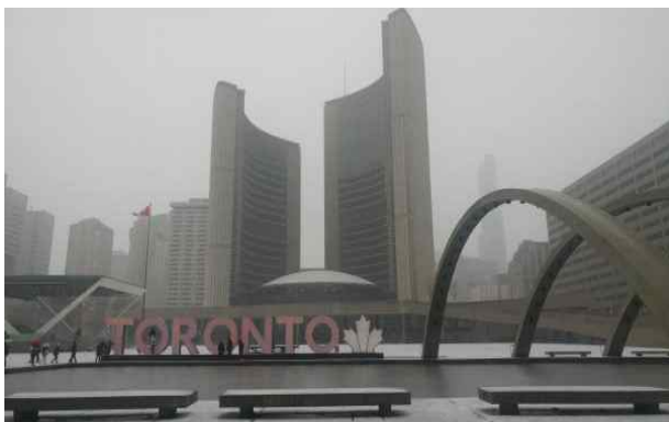
토론토 신시청 전경

• 이 광장은 모두에게 자유롭게 개방되어 있어 여름엔 시장이 서고 무료 공연이 열리는등 다양한 행사가 열린다. 특히 분수가 독특한데, 겨울에는 아이스 스케이트 링크로 바뀌며 무료로 스케이트를 탈 수 있어 시민들이 즐겨찾는 장소이기도 하다.