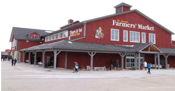
파머스 마켓 전경

• 세인트 제이콥스에서 가장 유명한 명소는 파머스 마켓으로 1975년에 세운 재래식 시장이다. 동절기는 목, 토 하절기는 화요일 추가 운영하는데 운영시간은 오후 3시까지이다.