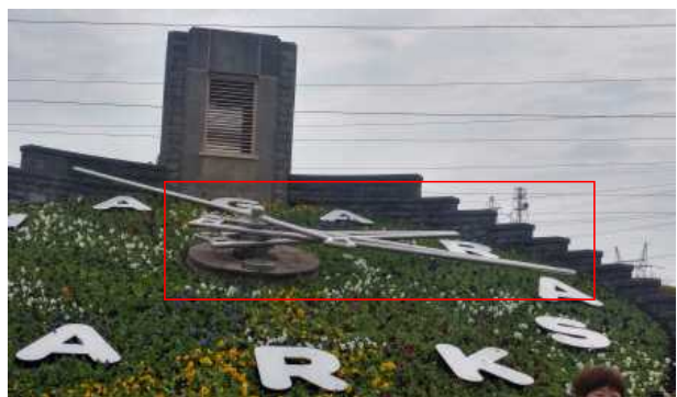
시침과 분침이 목발모양인 꽃시계