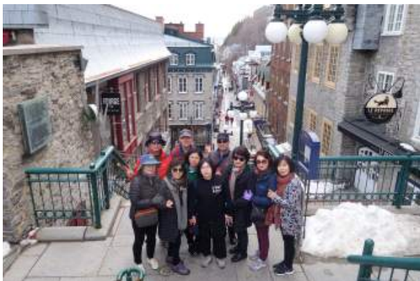
퀘벡 방문 단체기념

• 신문용지의 제조를 비롯하여 금속, 조선, 펄프, 피혁, 식품가공, 섬유 등의 공업이 성하며, 곡물·석유의 거래도 활발하다. 그러나 공업·무역 면에서는 새로 발전한 몬트리올을 따르지 못한다.