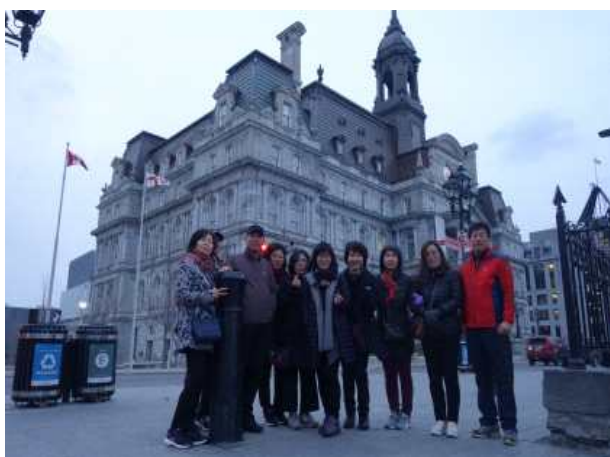
몬트리올 시청 방문