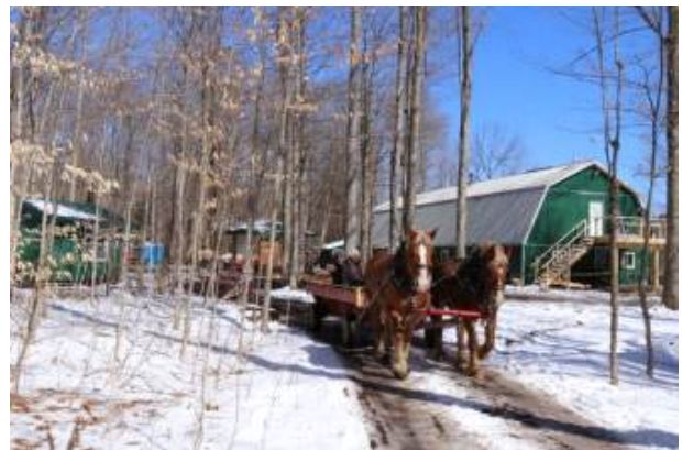
세인트 제이콥스 마을 방문