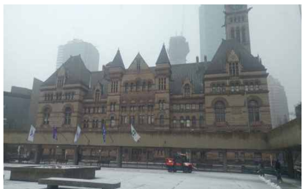
토론토 구시청 전경