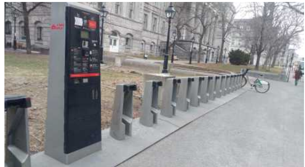
거리 자전거 거치대