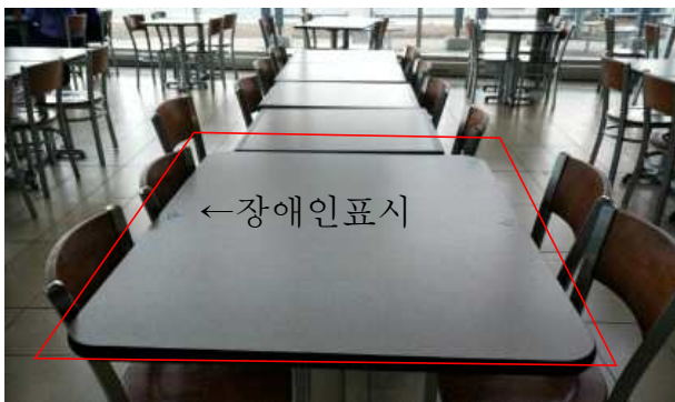
휴게소내 장애인 이용 테이블