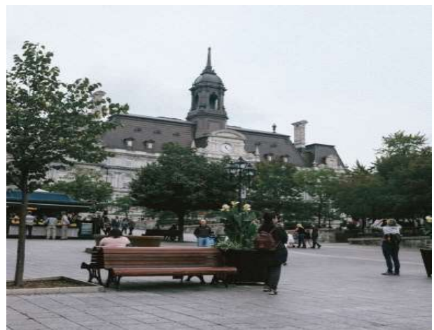
자끄 까르띠에 광장