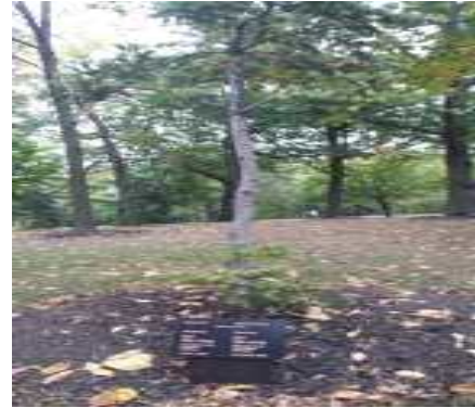
리도홀 정원내 김대중 대통령 식수