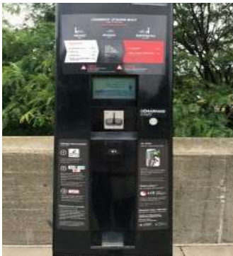
거리 자전거 무료 대여시스템