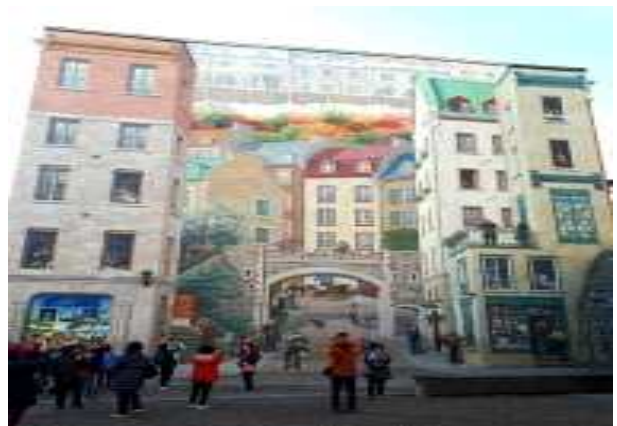
프레스코 벽화 건물