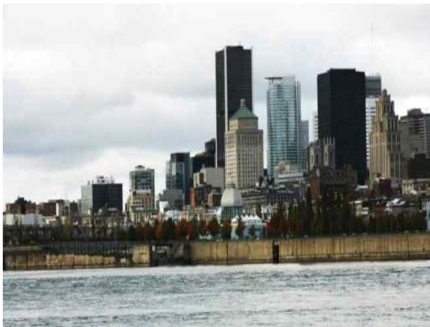
몬트리올 시 전경

• 몬트리올에는 트레이드 마크인 총 길이 30km의 언더 그라운드시티와 그 위 지상 수천여개의 상점이 밀집돼 있다. 쇼핑몰을 지나면 지하철역이 나오고 또 다시 백화점이 이어지는 식이다. 고층 빌딩 아래 지하 네트워크는 겨울 추위가 매서운 몬트리올 삶의 한 단면이다. 10여 개의 지하철역, 수백개의 레스토랑, 수천개의 상점 뿐 아니라 대학, 주택 등을 연결하고 있다.