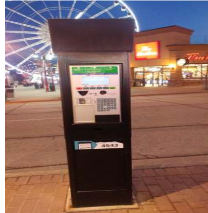
나이아가라 거리 자동주차 발권기